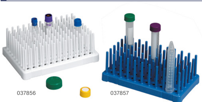
Rack à piques. Autoclavables.